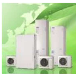
60cm トップ HT-D60S